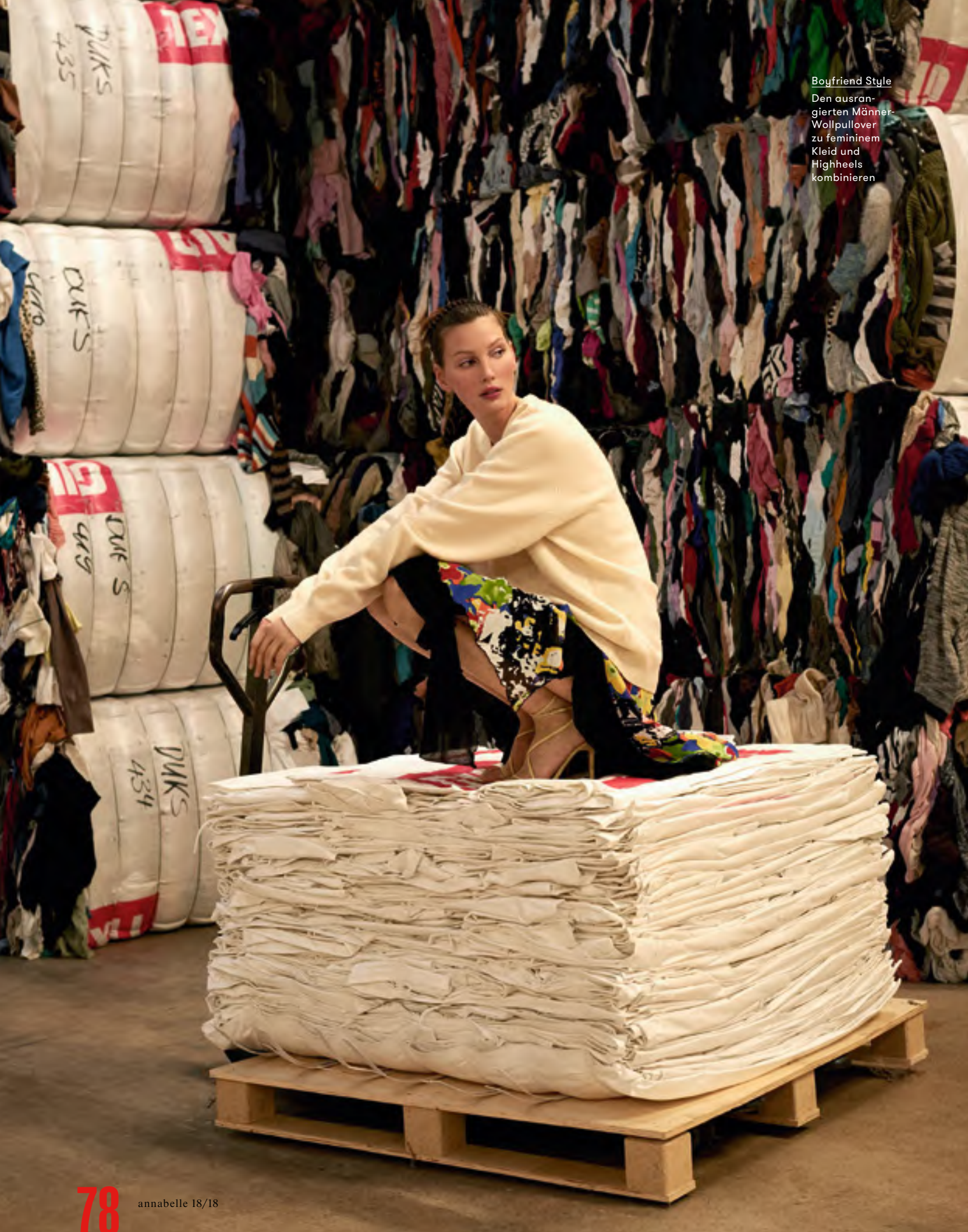
Boyfriend Style Den ausran- gierten Männer- Wollpullover zu femininem Kleid und Highheels kombinieren