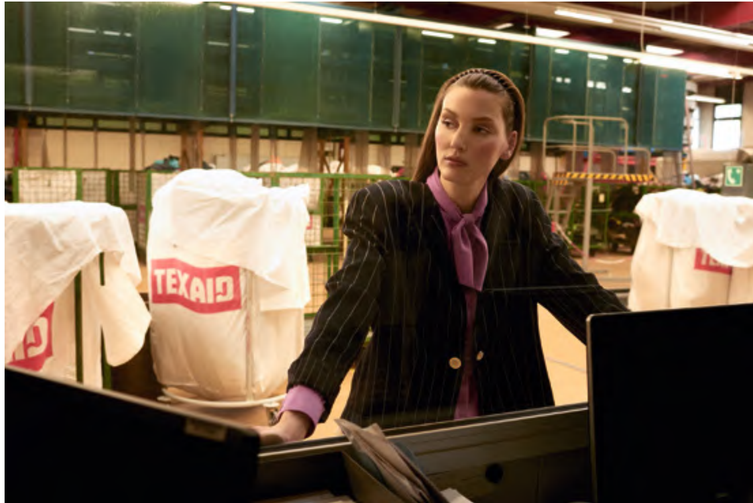
Streng genommen Schluppenbluse und Kastenjacke sind zwei Basics der Businessmode. Mit Nonchalance getragen werden sie zum langlebigen Dreamteam