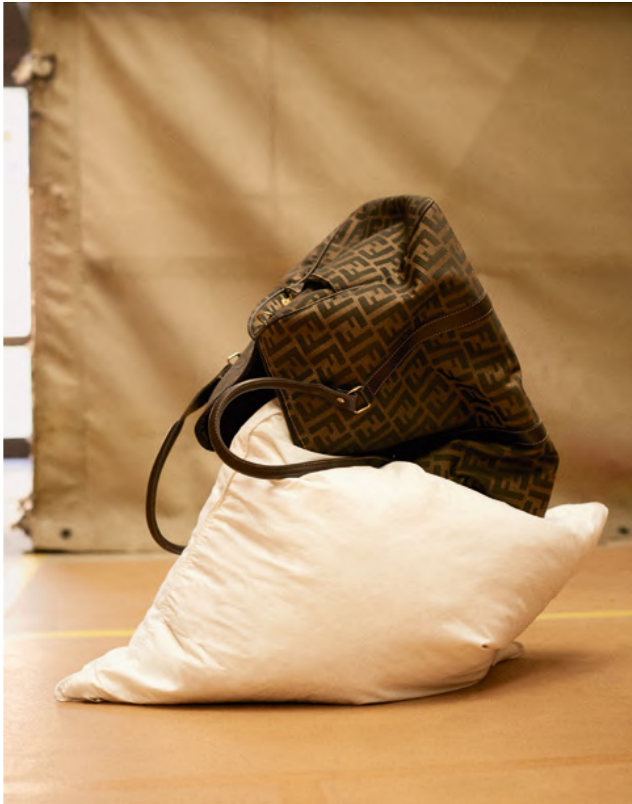
Logo-Bag Macht auch in Zukunft aus einem saloppen ein stylisches Outfit