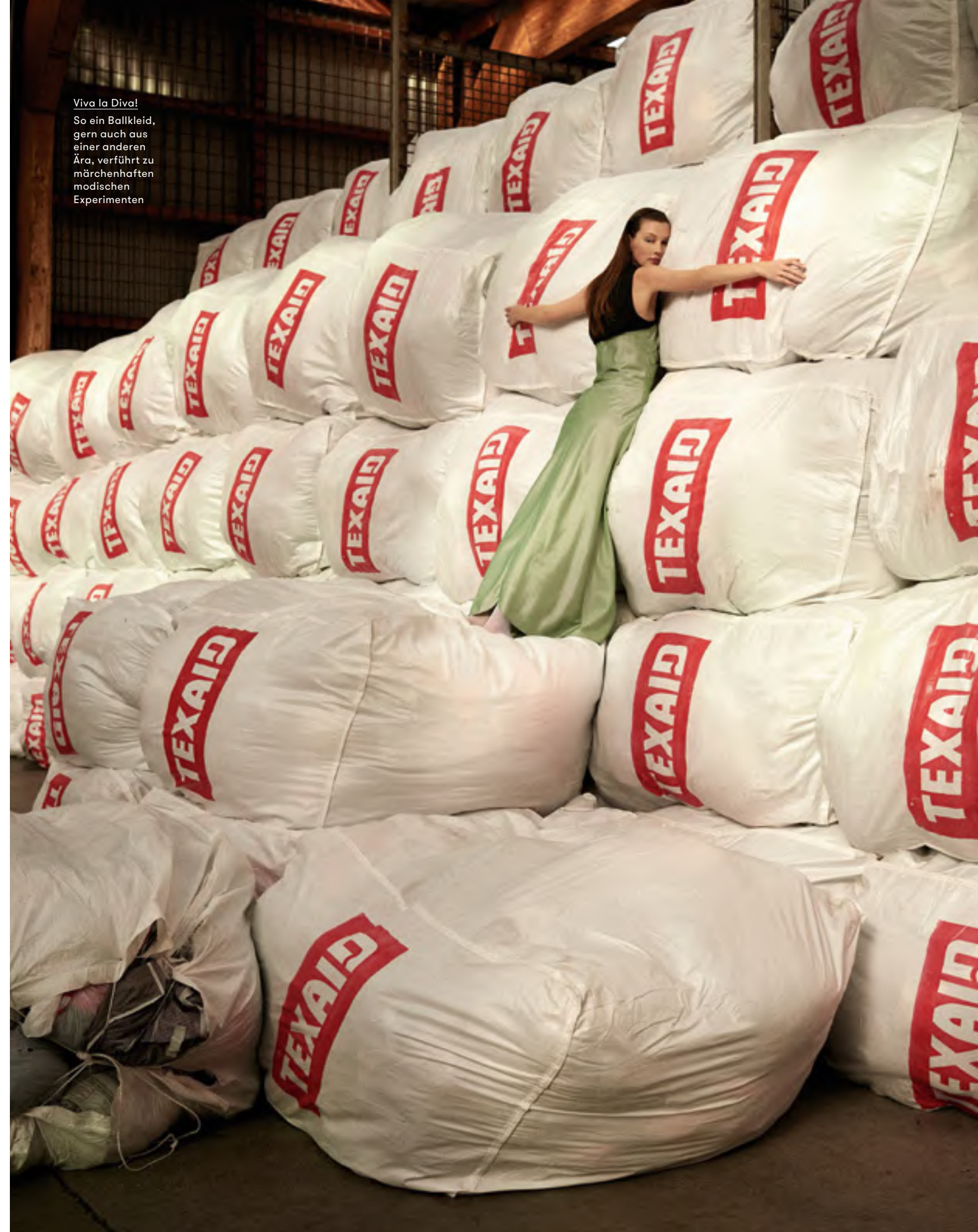
Viva la Diva! So ein Ballkleid, gern auch aus einer anderen Ära, verführt zu märchenhaften modischen Experimenten